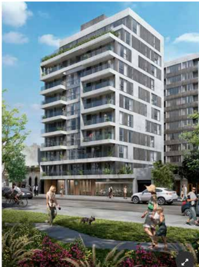
WEL ofrece unidades de 1, 2 y 3 ambientes entre 34 y 67 m2 con excelentes terminaciones.

La obra esta avanzando a muy buen ritmo con posesión prevista en noviembre de 2021 . A sólo 12 meses de la posesión, WEL cuenta con unidades desde U$S 1.992 /m2 con una atractiva forma de pago que se estructura de la siguiente manera: un anticipo en dólares + cuotas que pueden abonarse indistintamente en dólares o en pesos + CAC.