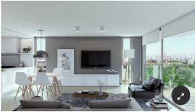
Interwin comercializa WEL, un desarrollo de dos edificios sobre la calle Moldes entre Lacroze y Teodoro García.

Los dos edificios que integran este desarrollo tendrán acceso por dos calles: Moldes 657 y Amenábar 746. Contarán con dos subsuelos de cocheras y full amenities: un importante SUM, piscina, solarium, gimnasio, sector de parrillas, laundry y seguridad por circuito cerrado de TV.